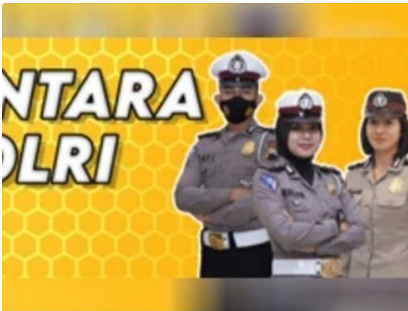
Penerimaan Polri Bakomsus