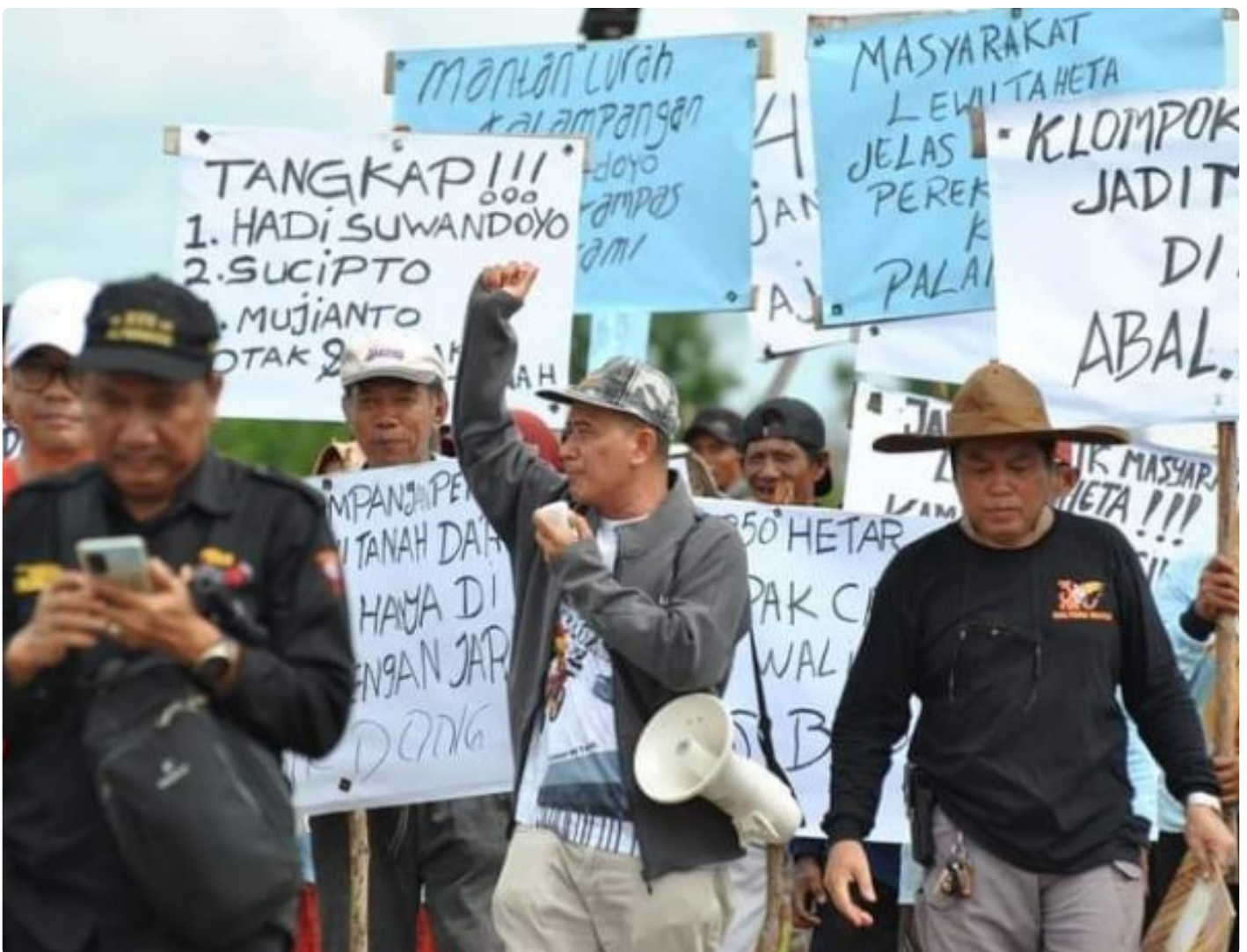
Gambar: Aksi Unjuk Rasa Masyarakat Kelompok Tani